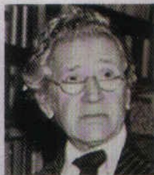
Juan José Arreola.